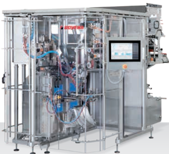
BVC 260/400 Flexible